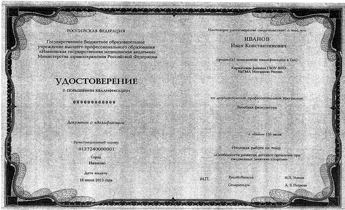
Рис 2. Пример заполнения бланка удостоверения о повышении квалификации