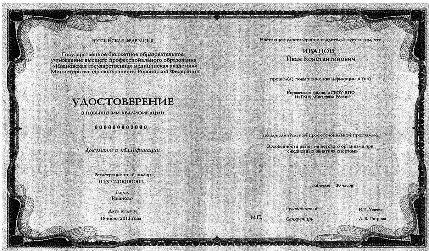
Рис 1. Пример заполнения бланка удостоверения о повышении квалификации